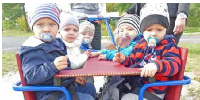
Kindergartenkinder und Krippenkinder beim Herbstausflug.